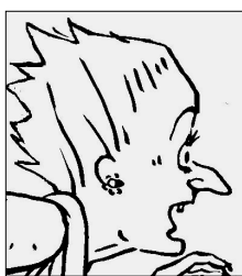
Адел, възрастна боязлива жена , от типа, който се страхува от нападател под леглото си