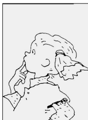
Амели, момиченце на 4 години.