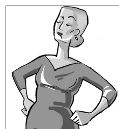
Берта,властна жена По-скоро агресивна. Невъзможно да промениш мнението ѝ