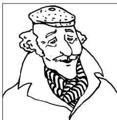
Алберт, възрастен глух мъж.